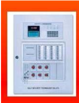
แผงควบคุม (Fire Alarm Control Panel)

เป็นส่วนควบคุมและตรวจสอบการทำงานของอุปกรณ์และส่วนต่างๆในระบบทั้งหมด จะประกอบด้วย วงจรควบคุมคอยรับสัญญาณจากอุปกรณ์เริ่มสัญญาณ, วงจรทดสอบการทำงาน, วงจรป้องกันระบบ, วงจรสัญญาณแจ้งการทำงานในสภาวะปกติ และภาวะขัดข้อง เช่น สายไฟจากอุปกรณ์ตรวจจับขาด, แบตเตอรี่ต่ำ หรือไฟจ่ายตู้แผงควบคุมโดนตัดขาด เป็นต้น ตู้แผงควบคุม(FACP)จะมีสัญญาณไฟและเสียงแสดงสภาวะต่างๆบนหน้าตู้ เช่น